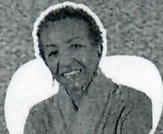
Leci Brandão Cantora