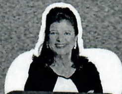
Luiza Trajano Presidente do Conselho de Administração do Magazine Luiza