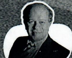
Renato Janine Ex-ministro da Educação