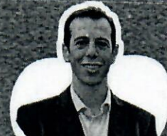
Renato Feder Secretário de Educação do Paraná