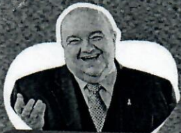
Rafael Greca Prefeito de Curitiba