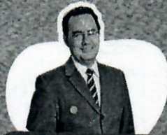
Augusto Cury Psiquiatra e escritor