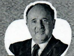
Cristovam Buarque Senador e Ex-ministro da Educação