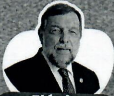
Flávio Arns Senador Federal