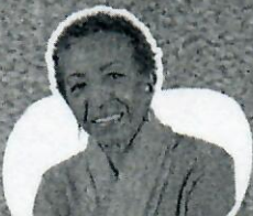
Leci Brandão Cantora