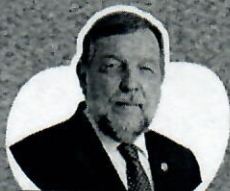
Flávio Arns Senador Federal