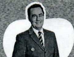
Augusto Cury Psiquiatra e escritor