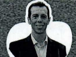
Renato Feder Secretário de Educação do Paraná