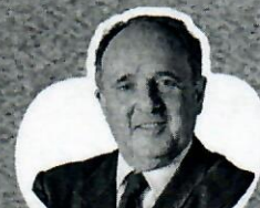
Cristovam Buarque Senador e Ex-ministro da Educação