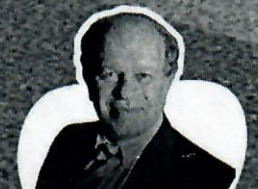
Renato Janine Ex-ministro da Educação