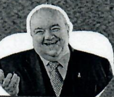
Rafael Greca Prefeito de Curitiba