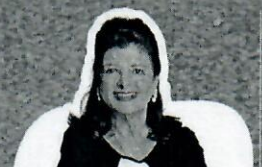
Luiza Trajano Presidente do Conselho de Administração do Magazine Luiza